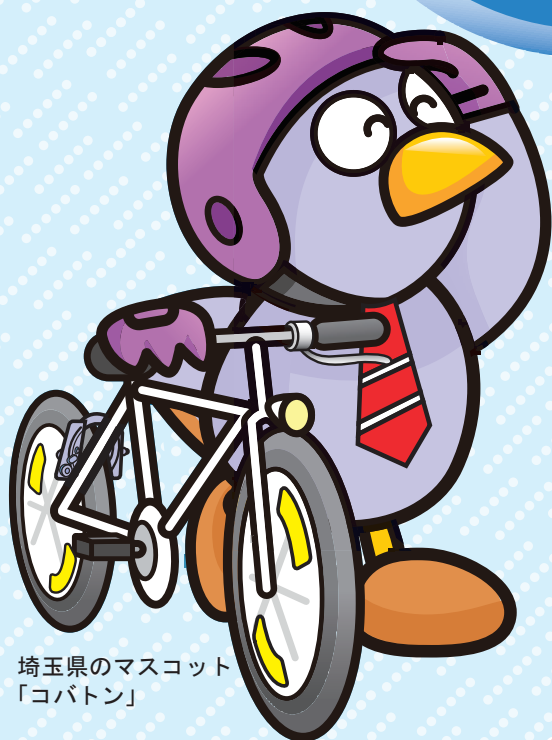
埼玉県のマスコット 「コバトン」